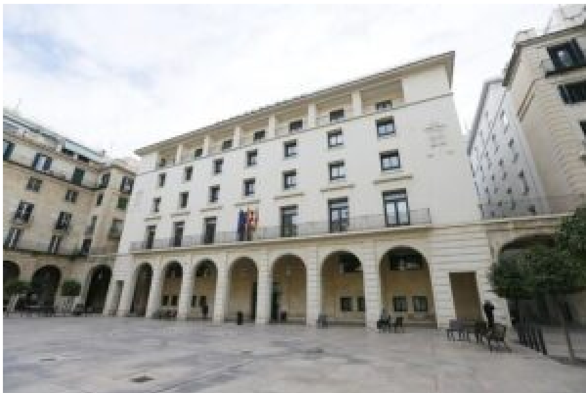
Audiencia Provincial de Alicante.