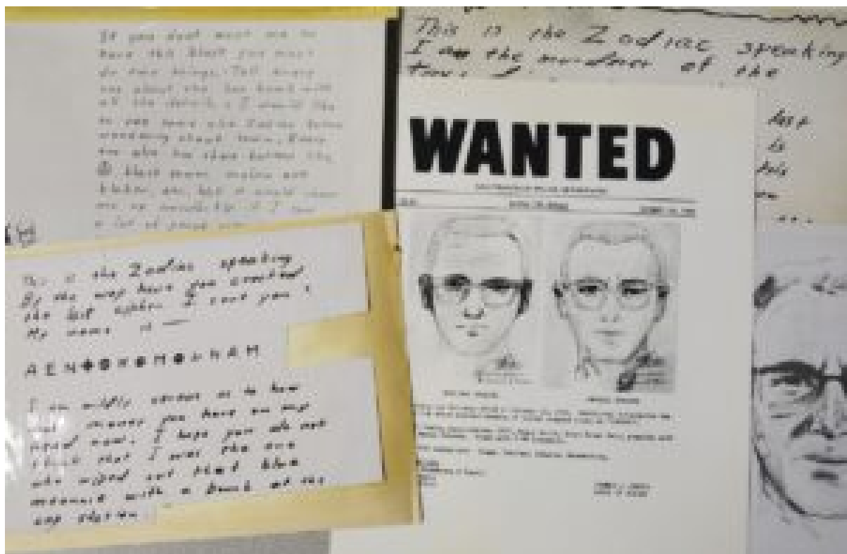
Cartas y retrato robo ...